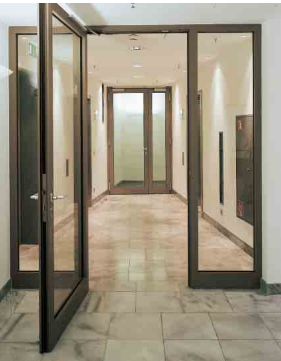
Schüco Firestop II EI60 Дверь с боковыми элементами Door with sidelights