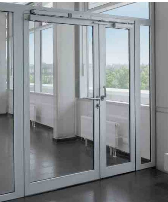
Schüco Royal S 65N RS Дымозащитная дверь Smoke door