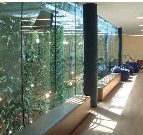
Schüco Firestop II F30 PG Внутренняя перегородка Interior partition wall