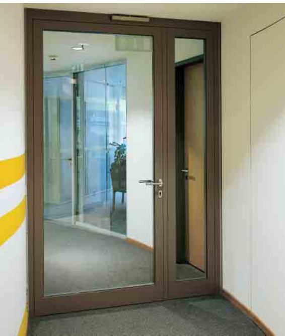
Дверь Schüco Firestop II T30, 2-ств. Schüco Firestop II T30 door, double-leaf